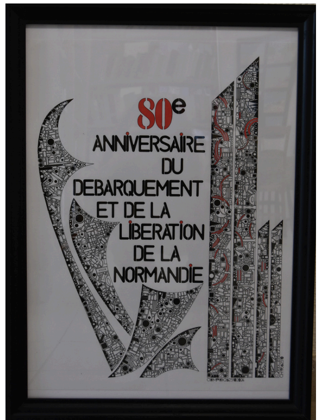
Gros plan de l'affiche de Philippe Grisé